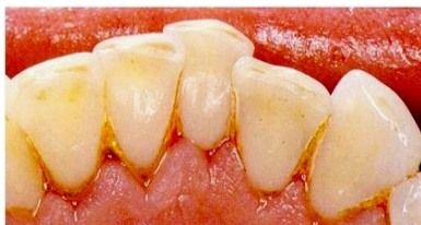
Nach der Zahnreinigung

Neueste Forschungsergebnisse zeigen, dass Bakterien aus diesen Belägen auch über die Blutbahn in den gesamten Körper gelangen können und, besonders bei schweren Zahnfleischerkrankungen, das Risiko für einen Herzinfarkt und Schlaganfall erhöhen können.