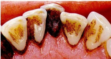
Vor der Zahnreinigung

Zahzwischenräume und Stellen unter dem Zahnfleischrand sind beim Zähneputzen oft schwer zu erreichen. An diesen Stellen bilden sich bakterielle Beläge und Zahnstein, die zu Zahnfleischbluten, Parodontitis, Karies und Mundgeruch führen können.